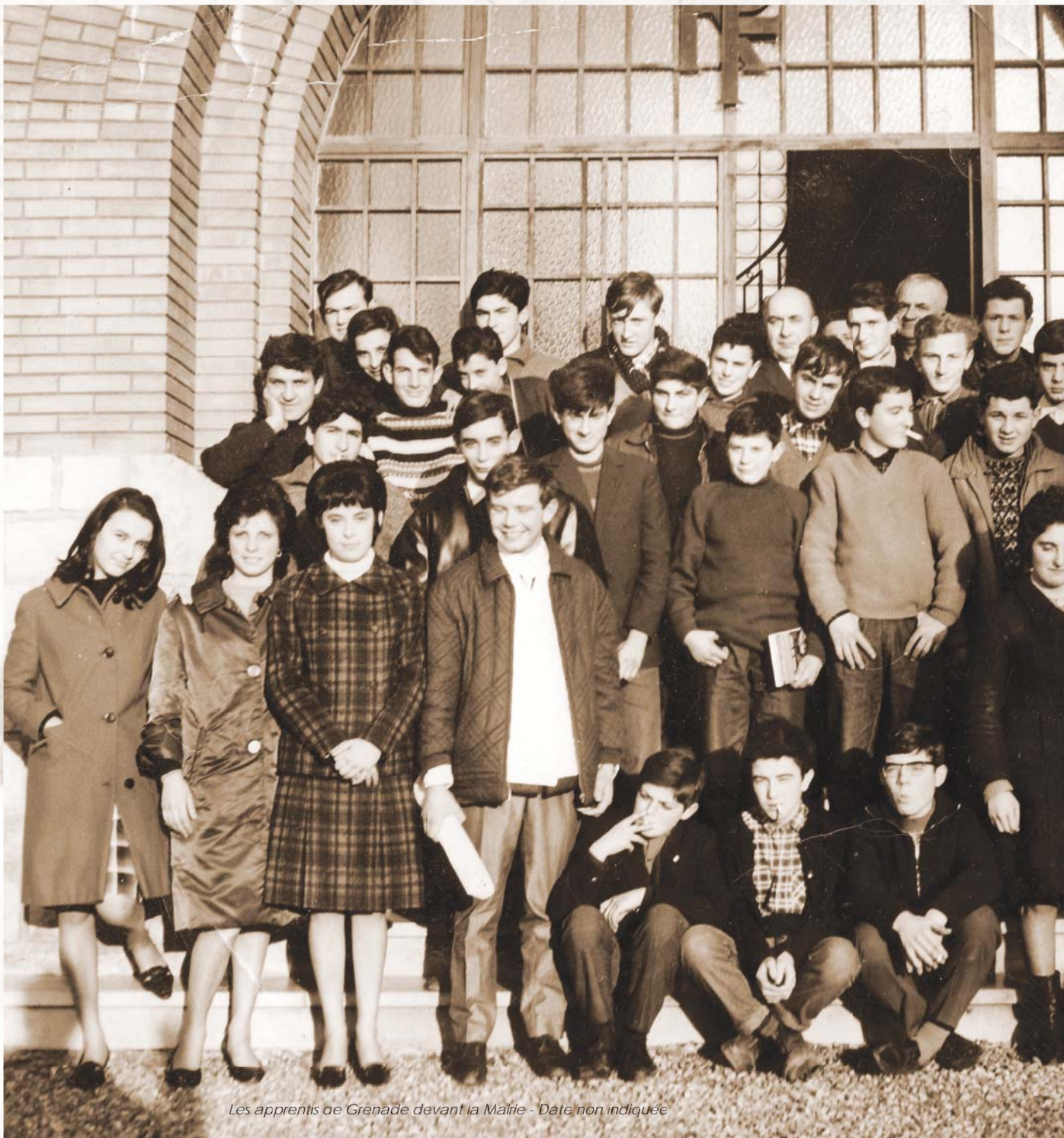
Les apprentis de Grenade devant la Mairie - Date non indiquée