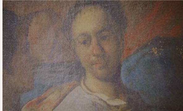
Détail sur le personnage supposé être l'autoportrait du peintre

Dans le cadre des Journées du Patrimoine, nous vous donnons rendez-vous jeudi 16 septembre à 14 heures 30 , en l'Église Notre-Dame de Grenade pour admirer le tableau Présentation de Marie au Temple (XVIII ème siècle - par Antoine Sieye) qui vient d'être restauré. Le restaurateur, qui sera présent, expliquera son travail.