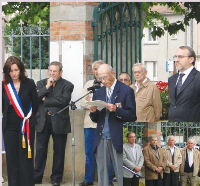
Dépôt de gerbe et discours

A l'occasion de l'anniversaire des 70 ans de l'appel historique du Général de Gaulle du 18 juin, une commémoration a eu lieu en présence des anciens combattants. Après le dépôt de gerbe au Monument aux Morts, les anciens combattants de la seconde guerre mondiale domiciliés sur la commune de Grenade se sont vus remettre un diplôme d'honneur, suivi d'un vin d'honneur offert par la Municipalité.