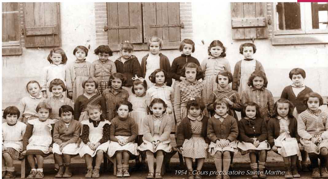
1954 - Cours préparatoire Sainte Marthe

Le cinéma 49 rue Pérignon a été créé pour financer le fonctionnement des deux écoles privées, celle des garçons et celle des filles. Il a fonctionné jusqu'en 1986.