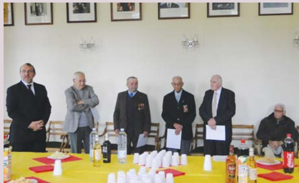
Remise de diplômes d'honneur aux anciens combattants