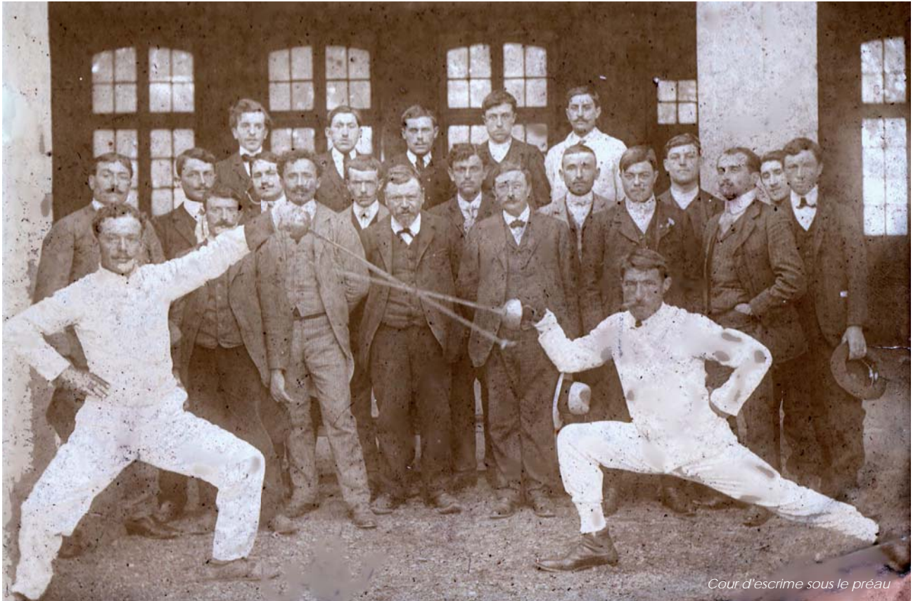
Cour d'escrime sous le préau

1956 marque un tournant pour l'histoire des écoles de Grenade. Le cours complémentaire a été ajouté à l'école élémentaire, qui permettait, entre autres, de préparer les concours de la fonction publique : poste, administrations... Le cours complémentaire a dû se déplacer, faute de place, dans des préfabriqués sur les allées Alsace-Lorraine. Les allées et venues des élèves et des enseignants étaient compliquées... C'est ainsi que sera construite l'école de la Bastide.