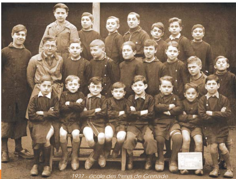
1937 - école des freres de Grenade

Il faut savoir qu'à tour de rôle, les enfants allaient servir la messe le matin, avant l'école ainsi que les deux messes du dimanche et les vêpres.