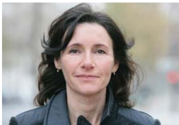
Véronique Volto, Conseillère Générale

Depuis 1984, le Conseil Général de la Haute-Garonne a opté pour la gratuité du transport scolaire vers les écoles, collèges et lycées et a supprimé toute participation financière des familles et des communes. Pour l'année scolaire 2009-2010, 78 264 élèves, dont 30 000 collégiens, ont bénéficié de la prise en charge du transport scolaire par le Conseil Général, soit plus de 45 millions d'euros. La gratuité du transport scolaire représente pour chaque famille une économie de 574 euros par enfant transporté.