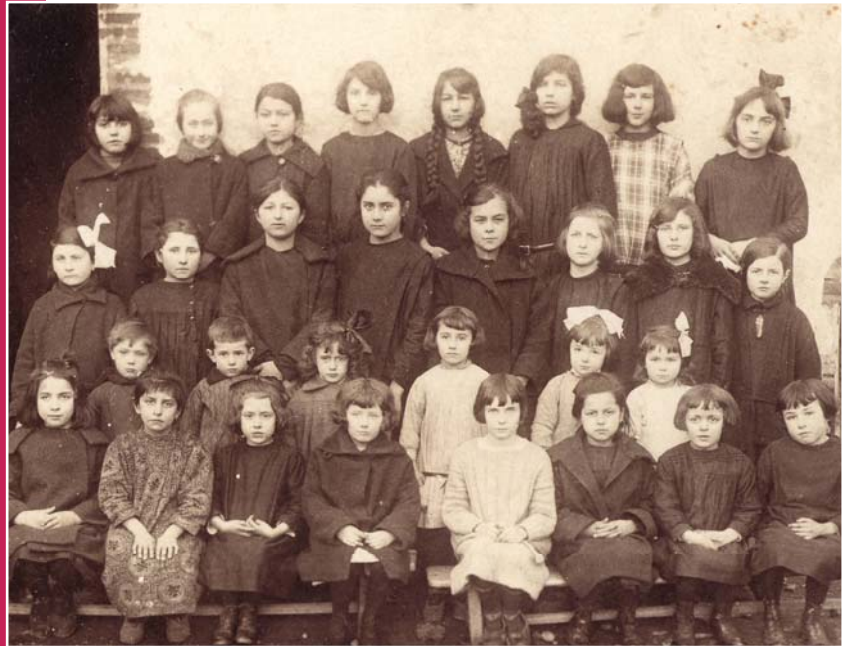
Ecole des soeurs Ursuline

Les pensionnaires étaient des jeunes filles riches, mais on introduisit très vite dans le monastère des petites filles externes, pauvres, pour y être gratuitement instruites.