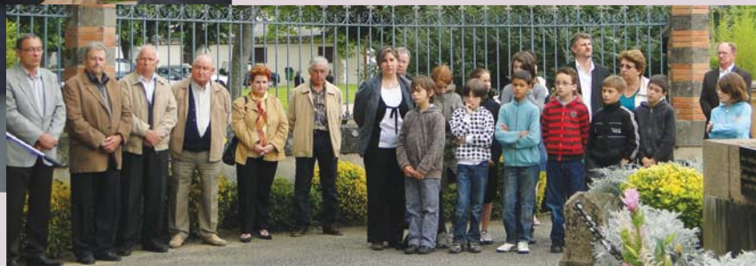
Les enfants de l'école Sainte-Marthe