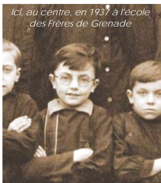
Ici, au centre, en 1937 à l'école des Frères de Grenade

gamin aux anciens francs , qui raconte son enfance à Grenade et dont il écrit actuellement la suite Je l'étais encore nouveau (gamin) . Il y fera toute sa primaire, comme en témoigne la photo datant de 1937 à l'école des Frères de Grenade, avant de partir étudier à Toulouse.