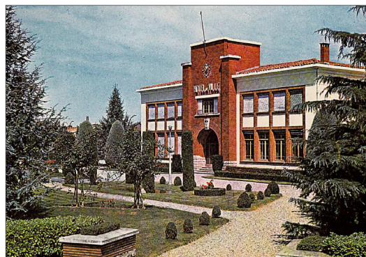
Réf. 10091 Grenade 31 L'hôtel de ville Editions Larrey 42 chemin de Tucaut St Simon 31 Toulouse