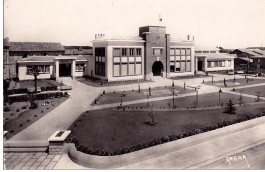
Réf. 2175 Grenade Hte Gne Le square et la mairie Editions ARGRA 14 rue de la concorde 31 Toulouse (9x14 cm)

Cette année, nous fêtons les 70 ans de la mairie.