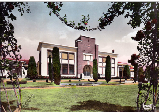
Réf. G. 1066 Grenade Hte Gne La mairie Editions Larrey 42 chemin de Tucaut St Simon 31 Toulouse