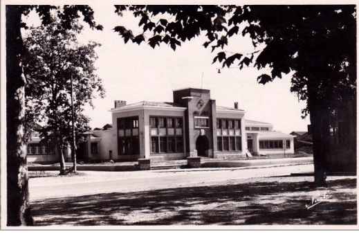
Réf. 3 Grenade Hte Gne l'hôtel de ville. Editions NARBO 61 Av. de l'U.R.S.S. 31 Toulouse (1954) (9x14 cm)