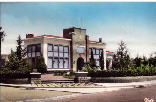
Réf. 5378 Grenade sur Gne. Hôtel de ville Editions Combiar Macon (9x14 cm)