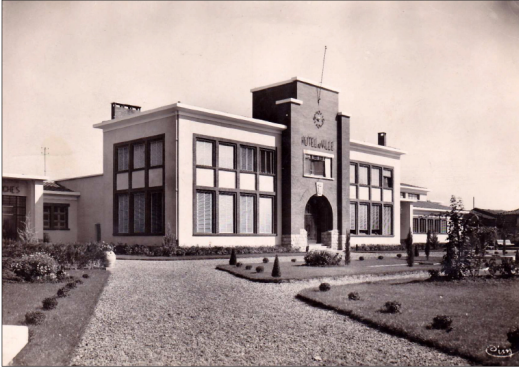
Réf. 11 Grenade sur Garonne l'hôtel de ville Editions Combiar Macon

Aujourd'hui les bains douches sont devenus des bureaux, la salle de cinéma est toujours en activité et le jardin a été réaménagé.